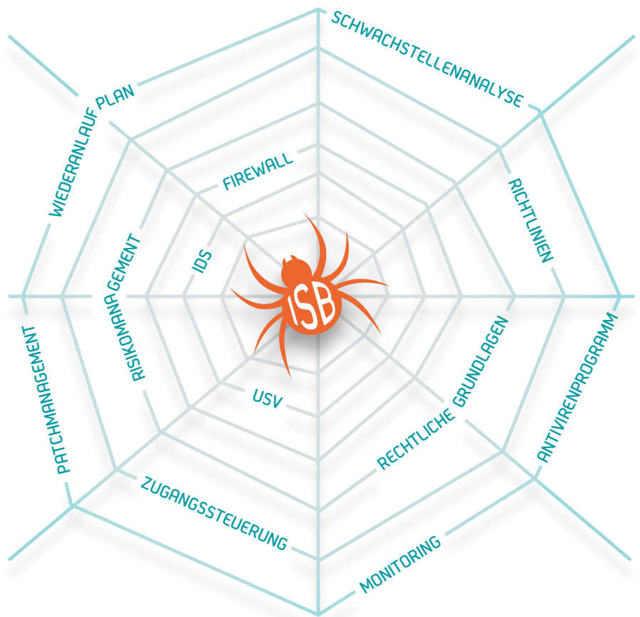
ISB (Informationssicherheitsbeauftragter) – die Spinne in Ihrem ISMS